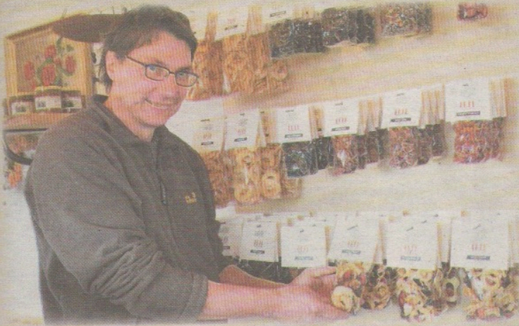
Produzent: Bruno Muff, Haldihof, Weggis